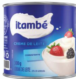
TABLE CREAM / CREMA DE LECHE / CRÈME FRAÎCHE